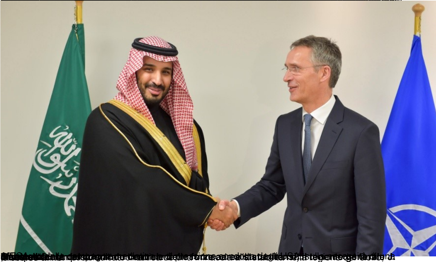
Il principe ereditario saudita Mohammed bin Salman con il segretario della Nato Jens Stoltenberg